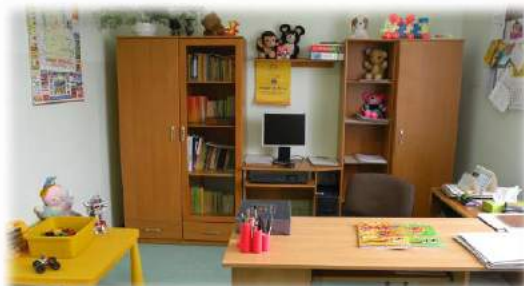
SIEDZIBA POWIATOWEJ PORADNI PSYCHOLOGICZNO - PEDAGOGICZNEJ W TARNOWIE FILIA W ŻABNIE