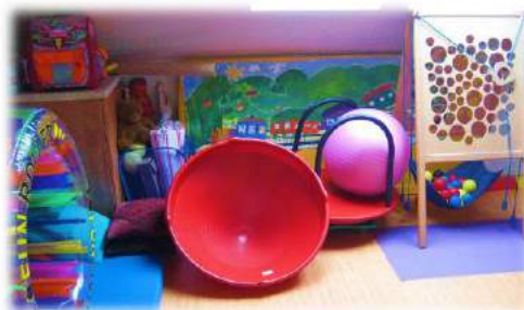
SIEDZIBA POWIATOWEJ PORADNI PSYCHOLOGICZNO - PEDAGOGICZNEJ W TARNOWIE FILIA W WOJNICZU